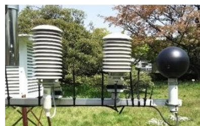
暑さ指数(WBGT)測定装置